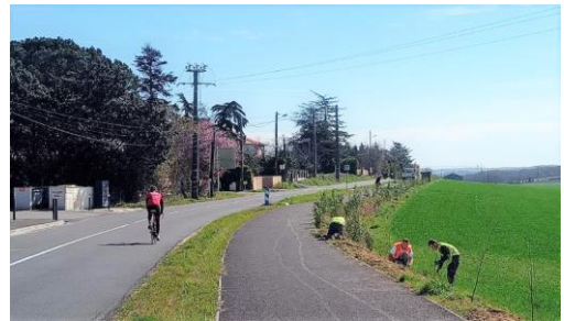
Plantations route de Flourens

Ci-contre, plantations au niveau de la Salle des Fêtes réalisées par nos employés municipaux