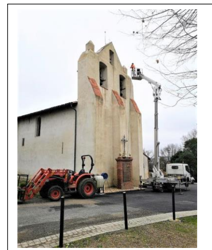
Nettoyage de la façade de l'église