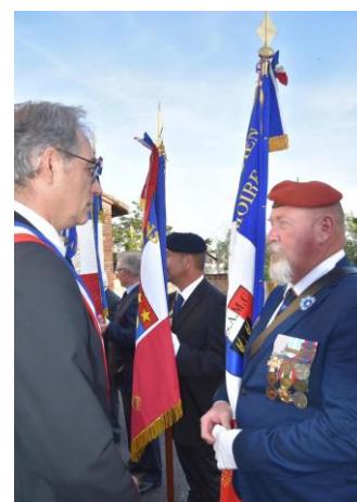
Remerciements aux porte-drapeaux