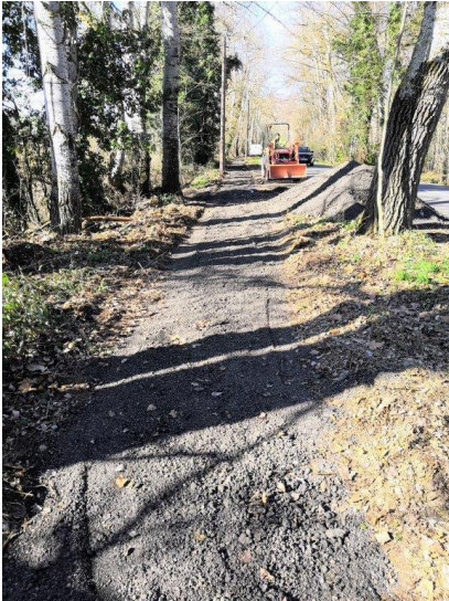
Création d'un chemin piétonnier Route de la Seillonne